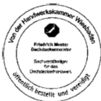
Originalgröße • 43 mm Durchmesser