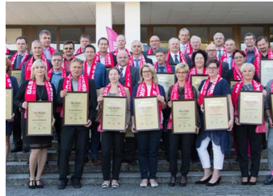
70 Silberne Meister