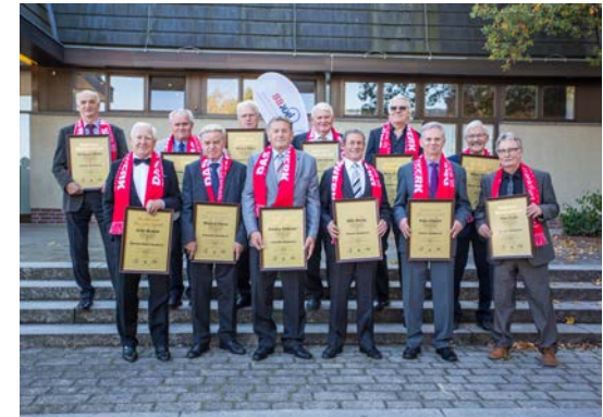
48 Goldene Meister