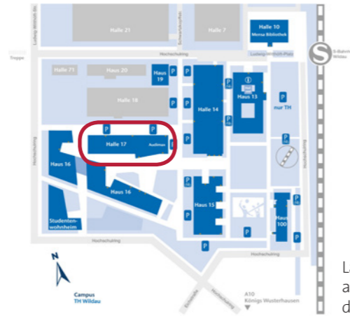
Lage der Halle 17 auf dem Campus der TH Wildau